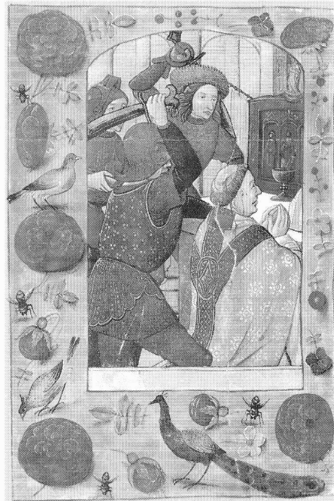
De dood van Thomas van Canterbury, in getijdenboek voor Engels gebruik. Gents-Brugse school, begin 16 de eeuw (Londen British Library, King's Ms 9, fol. 38v. Te zien in KORTRIJK en in BAUER).

LEEWARDEN Provinsjale Bibliotheek fan Fryslân: Topstukken uit